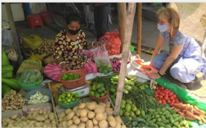
Voorzichtig zijn bij het boodschappen doen.

toch samen creatief te zijn door samen een knutselverhaal te schrijven dat ze elke dag met elkaar uitwisselen. Over een paar weken wordt er in dat gezin trouwens een baby verwacht - ook extra spannend voor de familie, in deze tijd!