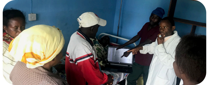
Uitleg X-ray aan patiënt

Patiënten met chronische ziekten hebben maanden geen medische zorg ontvangen en mensen hebben nagenoeg geen geld voor medische zorg. Gelukkig ondersteunt de GZB de patiënten bij de betaling van de medische zorg voor de eerste maanden.