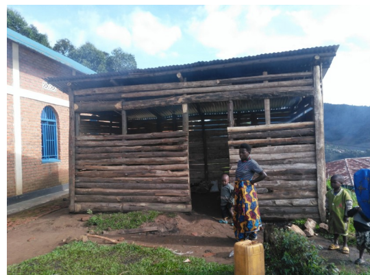
Koken in de nieuwe shelter

In de afgelopen tijd hebben we ook een nieuw programma kunnen starten in Nyarusange. Een zegen, want deze locatie stond al lang hoog op de lijst met probleemgebieden. Maar liefst 125 nieuwe ondervoede kinderen en volwassenen vonden we in deze regio!