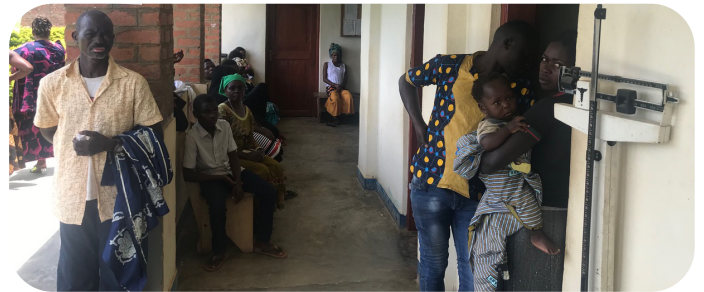
Weer patiënten in Itendei!