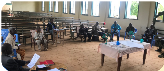
Reflectie dag over pygmeë project