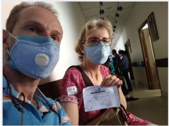
We zijn dankbaar dat we onze eerste vaccinatie hebben kunnen krijgen!