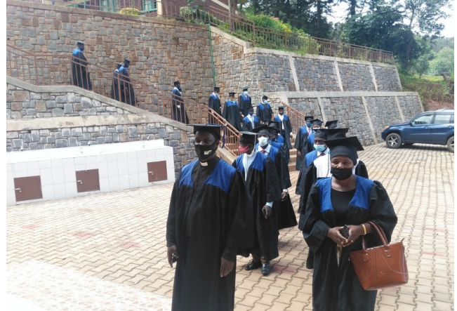
De studenten in processie voor hun uitreiking

Eind april is de tweede groep studenten vertrokken voor een studiereis naar Gahini. In deze plaats, in het oosten van Rwanda, vond in de jaren 30 van de vorige eeuw een grote opwekking plaats die zich over heel Oost-Afrika verspreidde en zorgde voor exponentiële groei van de kerk. Direct na terugkomst in Kamembe ontvingen de studenten in een wegens de coronamaatregelen bescheiden ceremonie hun certificaat.