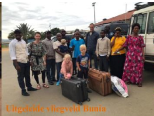
Lijgebode vliegveld Bunia