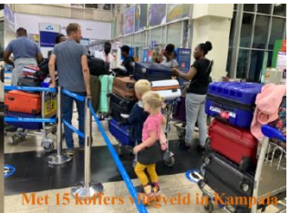
Met 15 koffers vliegveld in Kampala