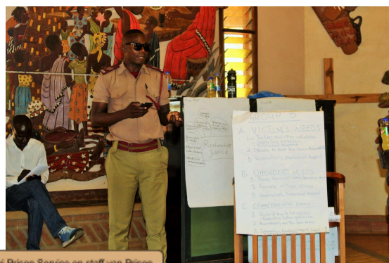
Introductietraining over Herstelrecht aan de Malawi Prison Service en staff van Prison Fellowship Malawi