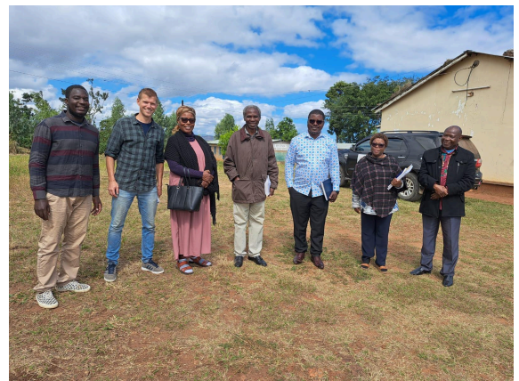
Bezoek aan een 'hervormings' centrum voor kinderen die op jonge leeftijd delicten hebben gepleegd