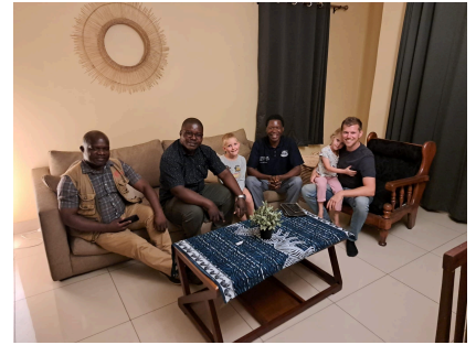
Collega's op bezoek bij ons thuis