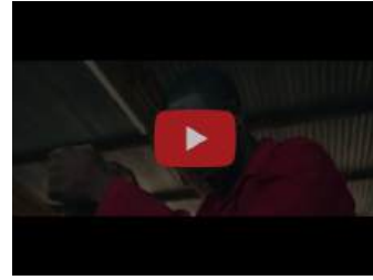
Dit filmpje werd getoond tijdens de Kerstnachtdienst.

Verder dank aan alle gevers die het werk van Care4Malawi financieel ondersteunen!