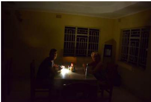
Geen stroom in Balaka.