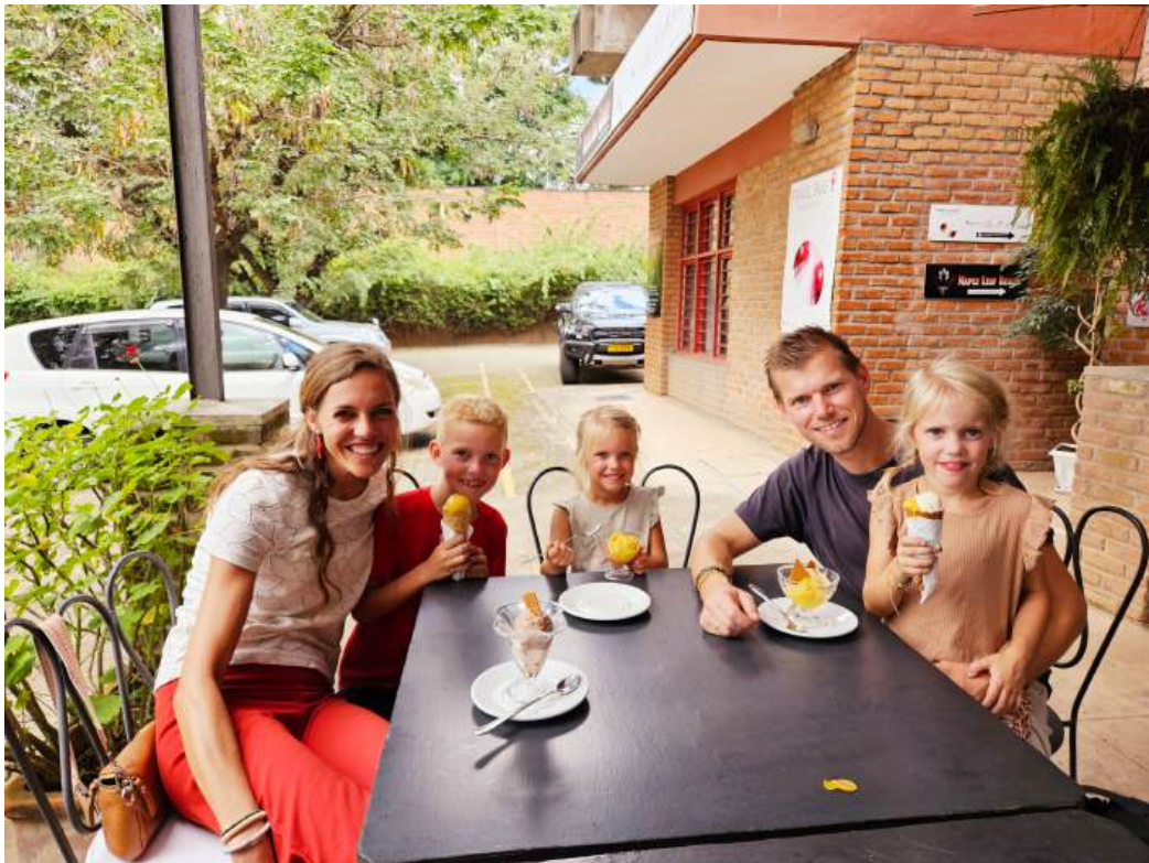
We eten een ijsje om te vieren dat we 1 jaar in Malawi wonen.