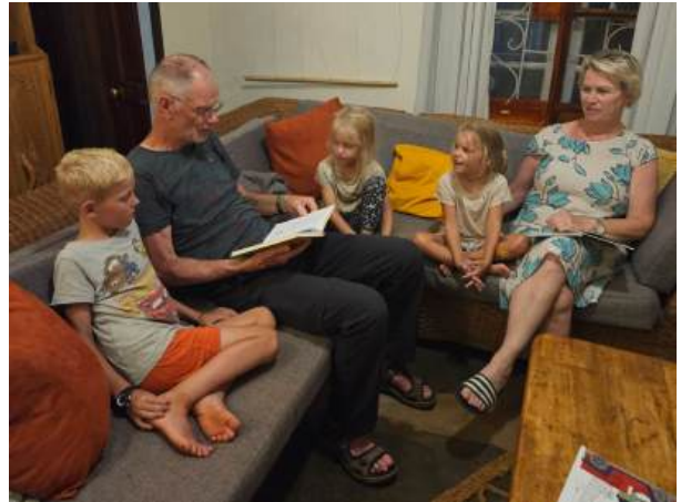
Genieten van het voorlezen door opa en oma.