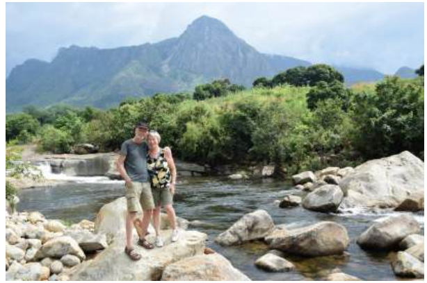
De prachtige Mulanje berg.