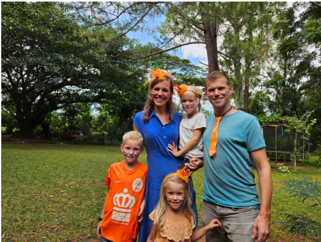
Dit jaar lieten we Koningsdag niet aan ons voorbij gaan en vieren we het met een groepje NL-ers.