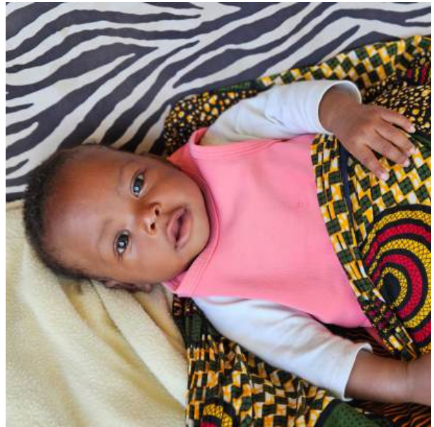
We genieten regelmatig van schattige Kimberly.