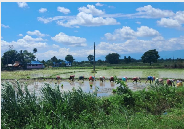
Onderweg genieten we van de uitgestrekte rijstvelden.